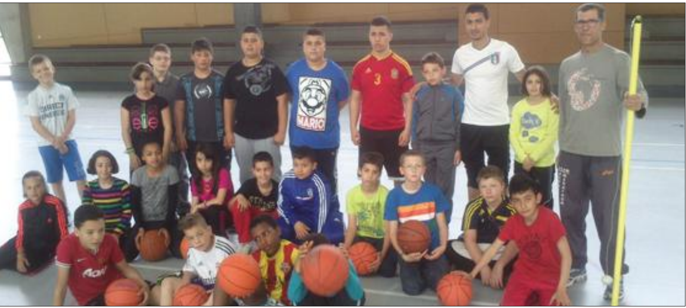
Les jeunes ont jusqu'à vendredi pour participer à de nombreuses activités sportives.

Les inscriptions se font tous les jours au complexe sportif Marcel-Cerdan. Renseignements au 03 87 89 58 50.